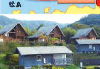
須佐湾エコロジーキャンプ場