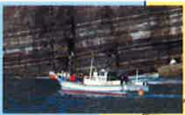
須佐ホルンフェルス