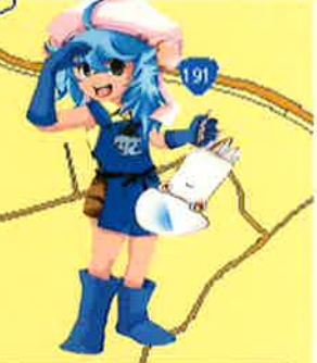
須佐観光協会PRキャラクター「海野みこと」